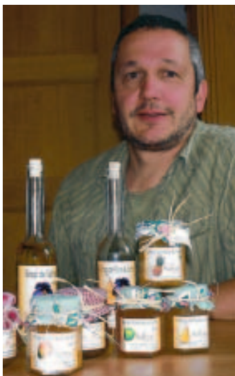
"On voulait se faire plaisir". ■ A.D.

Quelles recommandations aux utilisateurs? Sur notre stand, on déguste un peu de tout. Mais je vous recommande nos gau-