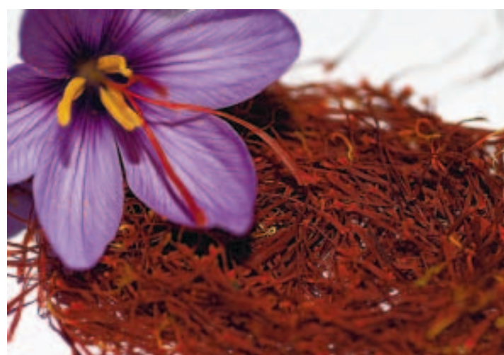
L'or rouge est issu des stigmates d'une variété de crocus. ■ A.D.